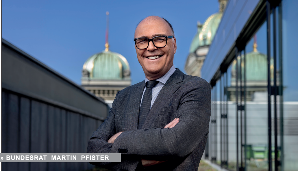
» BUNDESRAT MARTIN PFISTER